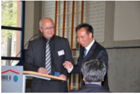
安徽省教育厅厅长祝贺汉诺威地区第六职业教育学 2012 年 10 月 14 日中国教师研讨会 校创新与未来中心开幕